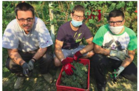
Alcuni dei protagonisti del progetto 8pari

no costantemente in vigna, cerchiamo di essere il più rispettosi possibile riguardo l'ambiente e quindi la nostra salute. I ragazzi del Progetto vengono in azienda due volte a settimana e ci aiutano in tutte le fasi di produzione, per avere una visione ampia del loro prodotto finito. Dedichiamo una piccola parcella di Arneis per il progetto, che si traduce in 800-1200 bottiglie a seconda dell'annata. Il prodotto è vinificato in acciaio: non passa nel legno per mantenere i profumi di fiori e la freschezza tipica dell'Arneis. I ragazzi si occupano della vigna, della