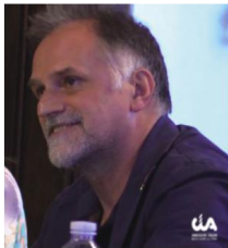
Il ministro del Turismo Massimo Garavaglia nella sede del Comune di Alessandria, dove era presente anche il presidente della Cia Piemonte, Gabriele Carenini

ravaglia si è conclusa in Cittadella, con la presentazione delle peculiarità storico-architettoniche del complesso monumentale. All'incontro con la Associazione di categoria svolto a Palazzo Rosso, sede del Comune, era presente il presidente regionale Cia Piemonte Gabriele Care-