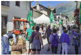
Il mercato contadino di Fenestrelle

Sul fronte della montagna, in concomitanza con la consueta pausa estiva dei