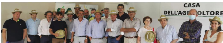
Lunedì 26 luglio si è svolta la Direzione regionale della Cia-Agricoltori Italiani Piemonte, presso la sede di Castelnuovo Calcea (At) - località Opessina. Con la partecipazione del presidente nazionale Cia, Dino Scanavino, si sono ritrovati tutti i dirigenti regionali e provinciali della nostra associazione.

I MIGLIORI RISULTATI SI OTTENGONO CON I MIGLIORI SPECIALISTI AL TUO FIANCO.