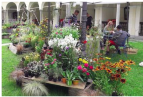
La fiera Artemisia a Gressoney-Saint-Jean

erba fresca e precipitazioni durante. Le gelate primaverili hanno causato delle criticità alla fiangeno e il tempo ballerino di giugno e luglio ha riservato delle sorprese non sempre piacevoli. L'inaffidabilità delle previsioni meteo sta diventando un problema serio».