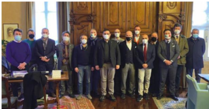
I rappresentanti delle istituzioni e delle associazioni che hanno firmato la nascita della Fondazione Aleramo