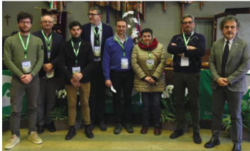
Sopra il nuovo comitato esecutivo e in basso il nuovo direttivo provinciale