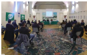
L'assemblea zonale a Pinerolo