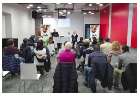
L'assemblea zonale a Chieri