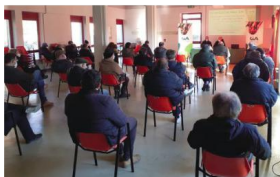
L'assemblea zonale a Caluso