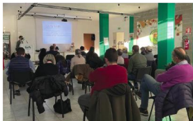
L'assemblea zonale a Torino