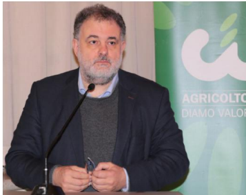
Federico Fornaro, deputato del Pd

Cia Alessandria ringrazia i parlamentari Riccardo Molinari e Federico Fornaro per l'impegno profuso che ha portato a buoni risultati di partenza, in accoglimento delle richieste presentate dall'Organizzazione avanzate anche al convegno Cia dello scorso 16 dicembre a Palazzo Monferrato, cui hanno partecipato gli stessi. In particolare, l'onorevole Fornaro ha lavorato agli Aiuti strutturali in arrivo per le imprese agricole colpite dalla Flavescenza Dorata, patologia che colpisce la viticoltura alessandrina, con un emendamento alla manovra che prevede l'istituzione di un fondo presso il Ministero dell'agricoltura, con una dotazione di 1,5 milioni di euro per il 2023 e 2 milioni all'anno dal 2024, per sostituire le piante di vite estirpate nei vigneti colpiti dalla malattia. L'onorevole Molinari è stato primo firmatario di