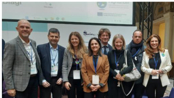
La delegazione Cia Piemonte e Cia Agricoltori delle Alpi che ha partecipato all'evento finale del progetto Highlander lo scorso 26 gennaio a Bologna

Il progetto Highlander, il cui obiettivo è utilizzare il supercalcolo al fine di ridurre i rischi associati ai cambiamenti climatici sul territorio italiano, elaborando dati per ottenere previsioni climatiche accurate, è stato finanziato dal programma europeo Connecting Europe Facility - Telecommunication Sector e coordinato da Cineca, con la partecipazione di Arpae, Arpa Piemonte, Art-Ed, Cia Piemonte, Centro euro-Mediterraneo sui cambiamenti climatici, Deda Next, European weather forecasts, Fondazione Edmund Mach e Uni-