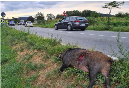
Foto di forte ripresa dei casi.

Nella Zona Rossa le regole che hanno imposto hanno portato ad uno "sciopero" dei cacciatori che non hanno nessuna conoscenza a fare le battute di caccia. Risultato: nella parte della Zona Rossa soggetta a maggiori restrizioni per le possibilità di infezioni, in Liguria sono stati abbattuti solo 98 capi, in Piemonte 546. Se si prende il totale dei capi abbattuti tra Zona Rossa e zone libere il dato è altrettanto allarmante rispetto agli obiettivi prefissati: in Liguria 1048 capi abbattuti rispetto ai 38.000 previsti; in Piemonte 9094 capi abbattuti rispetto ai 50.000 ipotizzati. Non esiste una "logistica" della gestione delle carcasse. Di fronte ad un obiettivo di depopolazione di quasi 90.000 capi, si sarebbe dovuto mettere in piedi un coordinamento stretto tra tutti i soggetti coinvolti, per realizzare un'organizzazione strutturata, con celle, luoghi di lavorazione e laboratori, per gestire il sistema di smaltimento e le diverse situazioni di carne inerte o sane. La recinzione - sulla cui effettiva utilità abbiamo più di un dubbio - va a rilente: ad oggi sono stati installati 105 Km sui 170 previsti. Non si hanno certezze di quando l'opera verrà completata in una