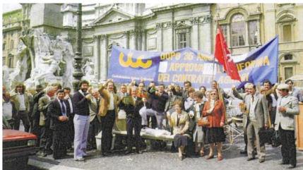
Foto storica del 29 aprile 1982. Roma, piazza Navona, i mezzadri di Siena brittano alla legge sui patti agrari appena approvata dal Senato. L'iter si è concluso dopo 35 anni di lotte

Dall'introduzione di Anna Graglia al Convegno all'Istituto Alcide Cervi per i 40 anni dal superamento della mezzadria