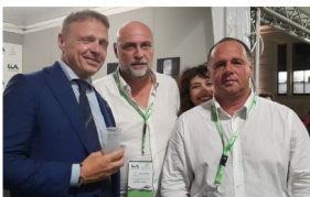
I nostri rappresentanti durante Terra Madre Salone del Gusto a Torino e il G7 Agricoltura a Siracusa insieme al ministro dell'Agricoltura, della sovranità alimentare e delle foreste Francesco Lollobrigida

zioni agricole dei Paesi del G7 - tra cui Cia - si sono riuniti per sottolineare il ruolo cruciale che gli agricoltori e le loro organizzazioni svolgono nella costruzione di sistemi alimentari resilienti, inclusivi e sostenibili.