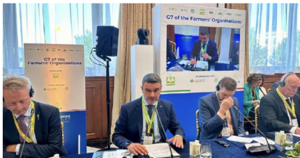
Il presidente nazionale Cia, Cristiano Fini, al G7 Agricoltura di Siracusa con i rappresentanti delle principali organizzazioni agricole dei Paesi del G7 e con la premier Giorgia Meloni

Le raccomandazioni chiave delineate nella dichiarazione includono maggiori investimenti pubblici in pratiche agricole sostenibili e resilienti al clima, il rafforzamento del commercio internazionale equo basato sulla reciprocità e sulla trasparenza e il progresso dell'innovazione incentrata sugli agricoltori che colmi il divario tra produttori e comunità di ricerca. Si richiama inoltre a un ap-