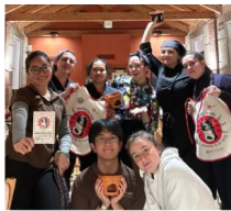
A sinistra, lo staff dell'agriturismo Terra d'Origine - Fratelli D'Amico - e a destra, il staff di Bagnacaval all'agriturismo "I Salici Ridenti" di Nizza Monferrato

lettiva e contemporanea al mondo, promossa per il dodicesimo anno dall'associazione culturale Asigliani che ne destina gli utili a favore di concrete azioni di solidarietà. Si celebra in più di 150 locali del Nord Ovest - ristoranti, cantine storiche, agriturismi - in tre fine settimana: 22, 23, 24 novembre e 29-30 novembre e 1 dicembre. A questi si aggiunge per la prima volta la Bagna della