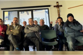
A group of people sitting around a table during the meeting.

all'area infetta e dunque più a rischio) e la zona 1, più distante dall'area infettata ma nella quale operano restrizioni per la caccia e per le operazioni di contenimento e del cinghiale. Restrizioni e divieti che hanno aumentato in modo significativo la presenza di cinghiali in un'area territoriale che dalla pianura irrigua del Novarese si estende a nord fino ai rilievi del Mottarone. In queste aree sono state pesantemente danneggiate le colture foraggere, i prati stabili coltivi dalle aziende zootecniche e sono a forte rischio le semine primaverili di mais, cultura da sempre tra le preferite dai cinghiali fin