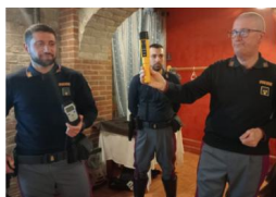
Gli incontri organizzati da Turismo Verde con i rappresentanti della Polizia Stradale ad Alessandria e ad Asti