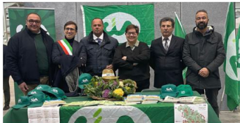
Lo stand Cia alla scorsa edizione di "Fai la mossa giusta" a Casale Monferrato