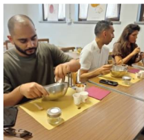
Alcuni momenti dell'iniziativa con cui ha ospitato una delegazione della Culinary Arts Commission dell'Arabia Saudita

nocciolotti e vigneti e un'esperienza nel laboratorio di trasformazione della nocciola, particolarmente apprezzato dalla delegazione.