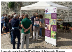
Il mercato contadino alla 49ª edizione di Artigianato Pinerolo

INDAGINE Più dei dazi, spaventano costo dell'energia e mancanza di competenze, tra competitività e resilienza