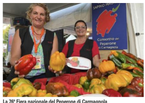
La 76ª Fiera nazionale del Peperone di Carmagnola