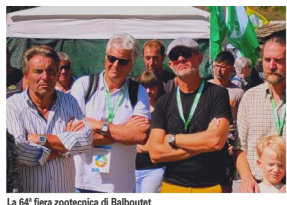
La 64ª fiera zootechnica di Balbout

Un messaggio forte, portato con coerenza e passione lungo un'estate ricca di incontri, mercati e momenti di confronto. Perché l'agricoltura, nelle sue molteplici forme, resta una delle chiavi per mantenere vivo il territorio.