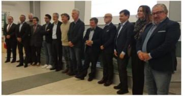
I relatori, gli organizzatori e il pubblico presenti il 17 dicembre al convegno Cia al Centro Ricerche dell'Ente Nazionale Risi a Castello d'Agnona