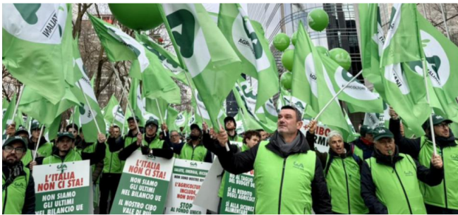
Alcune immagini della manifestazione del 18 dicembre a Bruxelles promossa da 40 organizzazioni aderenti al Coa-Cogeca con più di 10mila agricoltori, a cui ha partecipato anche Cia, per fermare la proposta di riforma della Pac, targata Ursula von der Leyen

«Quella che arriva oggi non è una protesta di categoria, ma un richiamo politico a tutte le istituzioni Ue. La Pac non è il passato dell'Europa, è una scelta strategica per il suo futuro -ha concluso il presidente di Cia-. Senza una politica agricola forte e autonoma non c'è cibo sicuro, tutela dell'ambiente, resilienza dei territori e futuro delle comunità. Ora è il momento che Bruxelles stia dalla nostra parte e scelga davvero di essere alleata di chi produce. Noi non ci fermeremo qui: continueremo a far sentire la nostra voce, con determinazione e senza arretrare di un passo».