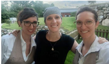
Le sorelle Vallomy che gestiscono l'agriturismo Ca' d'Amelio di Lessolo e le loro capre Camosciote delle Alpi